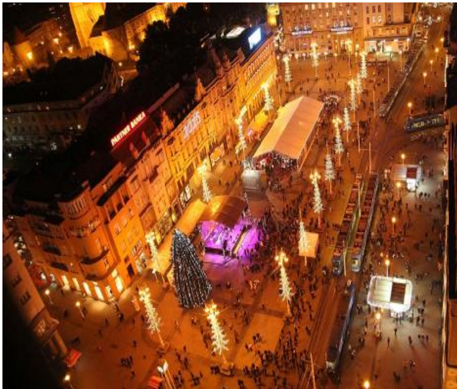
Adviento 2014 en Zagreb