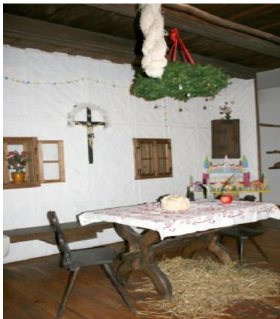
MNesa tradicional de Navidad

Kyrie Eleison: http://www.youtube.com/watch?v=3D5WLU0DRm8 Svim na zemlji: http://www.youtube.com/watch?v=9ZzSsTrARw0 Djetešce nam se rodilo: http://www.youtube.com/watch?v=MsMsvgjflAI U to vrijeme godišta: http://www.youtube.com/watch?v=Hlz214LUcLU Oj, pastiri: http://www.youtube.com/watch?v=tfNqBTwQDIk Radujte se narodi: http://www.youtube.com/watch?v=2nBe5C5oToc Tri kralja jahahu: http://www.youtube.com/watch?v=noDdH8cteJM Tiha noæ: http://www.youtube.com/watch?v=yL1m_yTSWPg