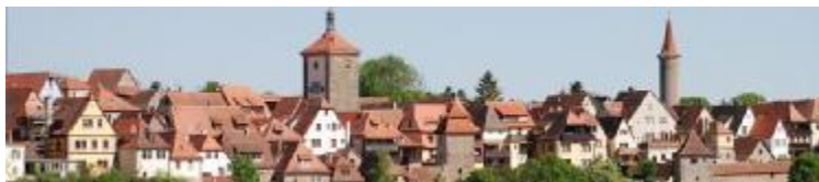
Rothenburg ob der Taube