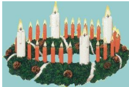
Corona de Adviento