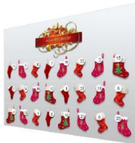
Juegos de San Nicolás